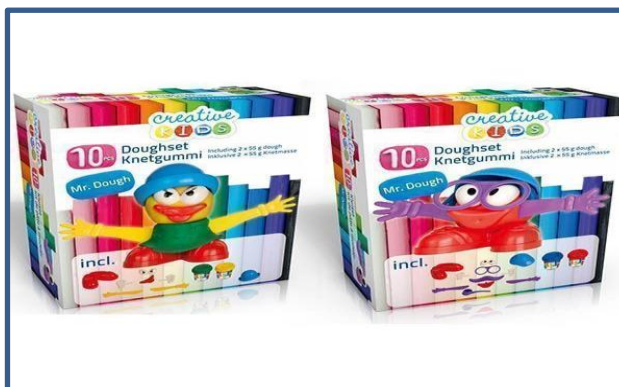
Photo de l'article Picture of the item

L'objet de la déclaration décrit ci-dessus est conforme à la législation d'harmonisation de l'Union applicable: The described object of the declaration is in conformity with the relevant Union harmonisation legislation: