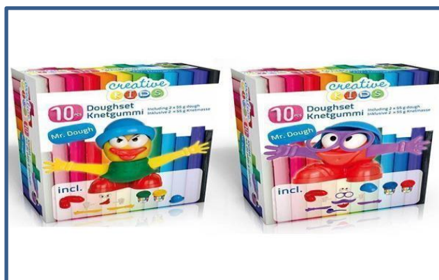
Foto van het artikel Picture of the item

Het beschreven voorwerp is in overeenkomst met de desbetreffende harmonisatiewetgeving van de Unie: