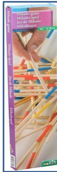
Foto des Artikels Picture of the item

Der Artikel wie beschrieben ist konform mit den einschlägigen Harmonisierungsrechtsvorschriften der Union: The described object of the declaration is in conformity with the relevant Union harmonisation legislation: